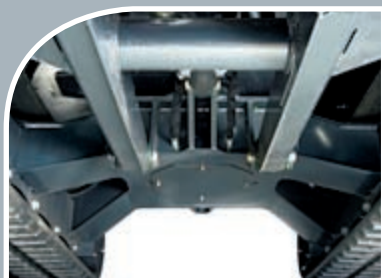
Der neue X-förmige Unterwagen erhöht die Bodenfreiheit und lässt Schutt und Schmutz besser ablaufen.

Dank des Schalters am linken Joystick ①. Gegenüber der klassischen Pedalsteuerung haben Sie hiermit drei große Vorteile: Punktgenaues Verschwenken, bessere Ergonomie und wesentlich mehr Fuß- und Beinfreiheit!