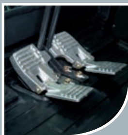
Die neuen, ergonomisch gestalteten Aluminium Fahrpedale sorgen für eine feinfühligere und sichere Bedienung der Maschine.