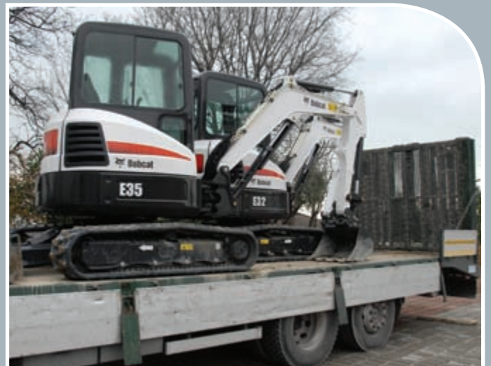
Kompakt und einfach zu transportieren.