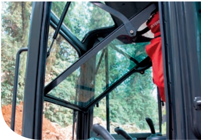
Sie haben den vollen Durchblick: der E32 und E35 bieten eine 360° Rundum-Sicht.

In einer angenehmen, effizienten Umgebung lässt es sich einfach bequemer arbeiten! Deshalb legen wir besonders großen Wert auf Komfort. Im E32 und E35 ist der Fahrer deutlich weniger durch Vibration, Hitze-Entwicklung und Lärm belästigt, dank diverser neuen Komponenten: Motor, Luftansaugung und Kühl- und Abgassysteme. Unsere Kabine bietet mehr Platz, beste Rundum-Sicht und Komfort rund herum.