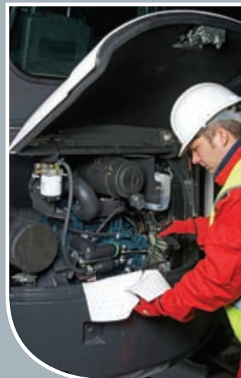
Schnelle Wartung durch leichten Zugang zu allen Komponenten und durch zentrale Schmierpunkte. Selbst nachspannende Keilriemen bedeuten weniger Beachtung!