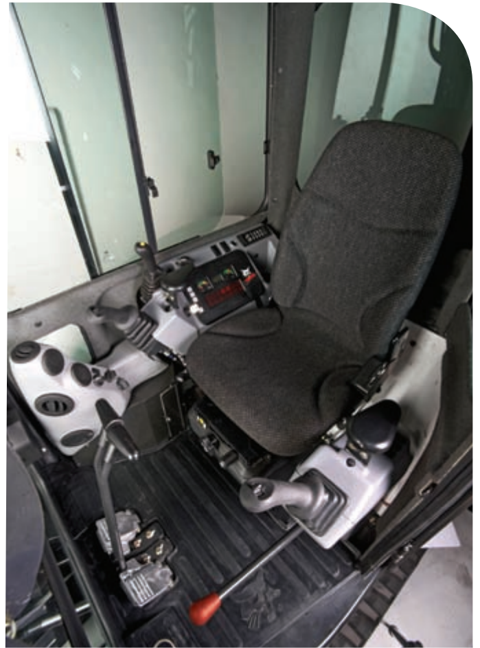
Die Kabine wurde von innen nach außen entwickelt und bietet dem Fahrer einen geräumigen, komfortablen Arbeitsplatz.